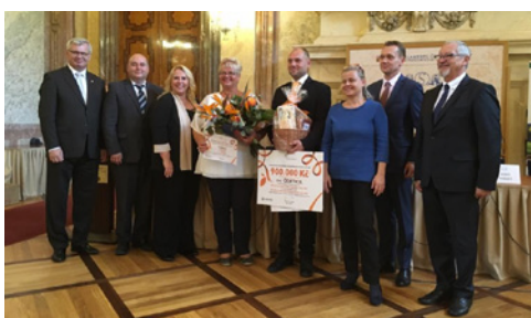
Představitelé vítězné obce Čejetice s oceněním v zástupu pořadatelů