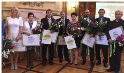
Vítězné zelené stuhu

Oranžovou stuhu České republiky 2017 v rámci soutěže Vesnice roku získala obec Čejetice z Jihočeského kraje. Druhá skončila Žlutava ze Zlínského kraje a na třetím místě obec Vrbátky z Olomouckého kraje. Celostátní výsledky byly vyhlášeny 25. 9. v Senátu. V krajských kolech letos uspělo deset obcí, a to: Břiměstě (Liberecký kraj), Čejetice (Jihočeský kraj), Hradec nad Svitavou (Pardubický kraj), městyse Kolinec (Plzeňský kraj), Nahořany (Královéhradecký kraj), Nová Lhota (Jihomoravský kraj), Nový Kostel (Karlovarský kraj), Srbská Kamenice (Ústecký kraj), Vrbátky (Olomoucký kraj) a Žlutava (Zlínský kraj).