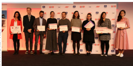
Vítězové letošního ročníku soutěže YAA

Ocenění autoři disponují značným talentem a invencí. Je zřejmé, že část nově nastupující ar-