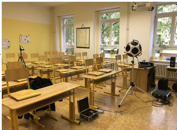
Záběr jedné z učeben ZŠ Komenského náměstí ve Slavkově, v níž se prováděla měření kvality vnitřního prostředí

Proč je důležité vytvářet energeticky šetrné a udržitelné budovy? Odpovědi na tuto a další otázky nabídne 6. ročník mezinárodní konference Šetrné budovy 2017, která se uskuteční 14. listopadu v pražském Clarion Congress Hotelu. „Naším cílem je vyvolat diskusi a podnítit úvahy o podobě a navrhování staveb, v nichž žijeme a pracujeme,“ říká Simona Kalvoda , výkonná ředitelka Čes-