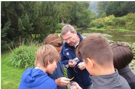
Žáci ze ZŠ Velké Březno (Ústecký kraj) v akci. Měří Ph vody v zámeckém parku.

Společnost Recyklohraní vytvořila a s finanční podporou SFŽP ČR zajišťuje nový environmentálně laděný vzdělávací program Recyklace očima mladého vědce, který podporuje třídění a recyklaci baterií a elektroodpadu a s nímž navštěvuje v průběhu podzimu školy po celé České republice. Ukazuje vliv člověka na přírodu a vede děti k tomu, aby si uvědomily, jaké mohou být následky nevhodného lidského chování. V rámci